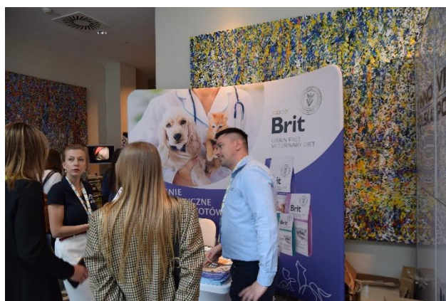
Fot. 7 Przestrzeń wystawiennicza II Konferencji Tematycznej PSLWMZ

Dziękujemy wykładowcom, uczestnikom i wystawcom za obecność. Dziękujemy również naszym Patronom Medialnym – Weterynarii w Praktyce oraz weterynarianews.pl.