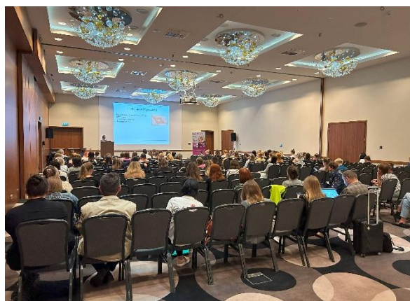
Fot. 2 Wykład prof. Marka Galantego z chirurgii górnych dróg moczowych